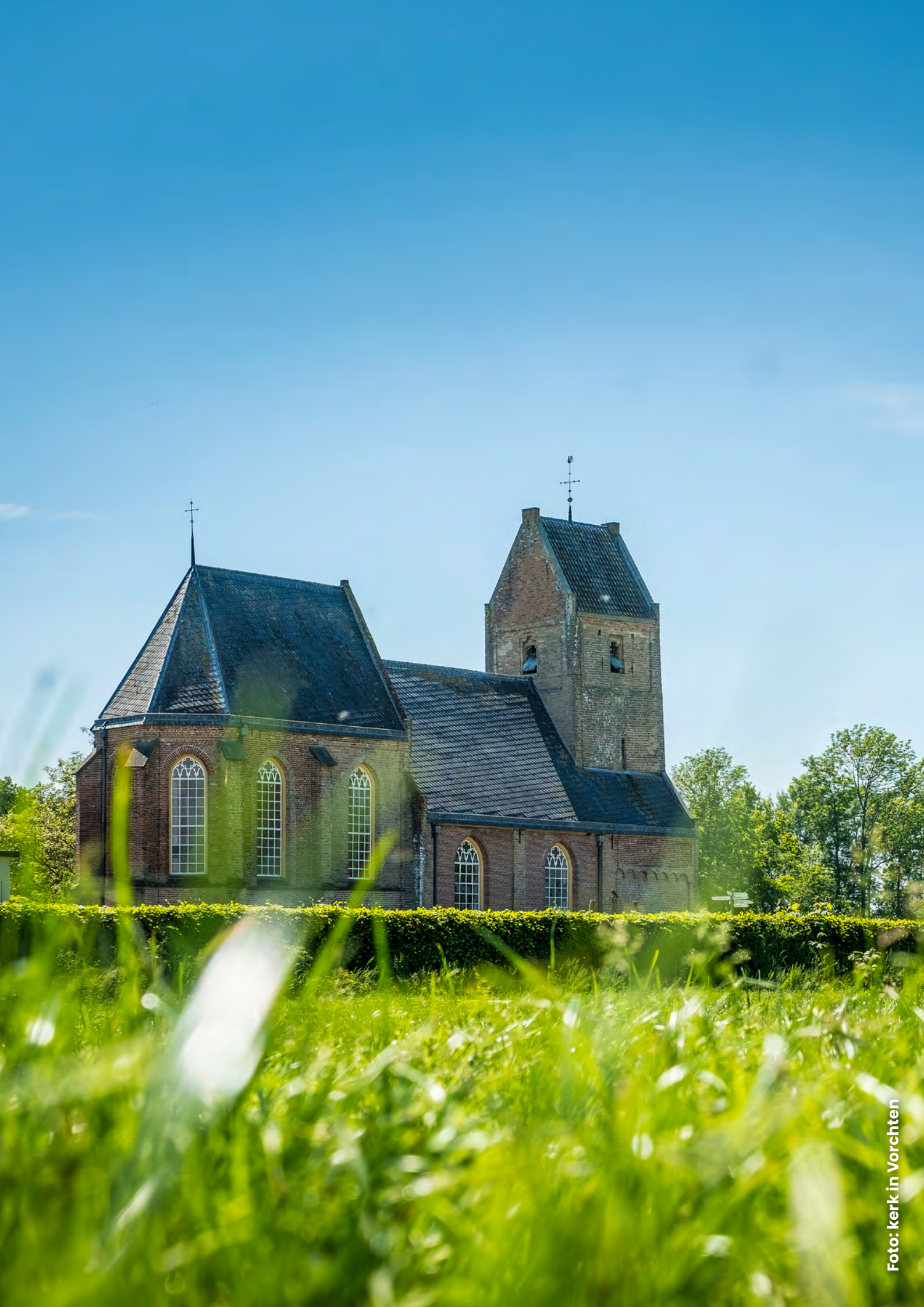
Foto: kerk in Vorchten